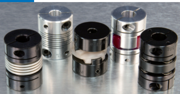
Giunti flessibili per alberi, basati su diversi concetti costruttivi.

Giunti flessibili a soffietto metallico, per compensazione di disallineamenti tra alberi rotanti, trasmissione rigida nel senso della torsione, esente da elasticità radiale. I giunti a soffietto appartenenti alla serie costruttiva "miniatura" sono ottimali per i piccoli azionamenti o le applicazioni con accoppiamento di encoder o altri sensori rotativi; giunti della serie "trasmissione di potenza", interamente realizzati in acciaio inossidabile, trovano applicazione tipica negli azionamenti delle macchine utensili, per esempio tra servomotore e vite a ricircolo di sfere. Produzione in Europa, distribuzione dal 1988.