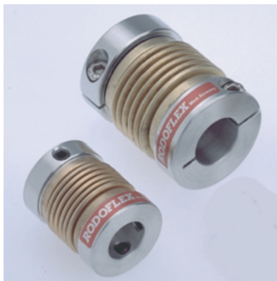
Giunti in miniatura per accoppiamenti leggeri, per esempio encoder.