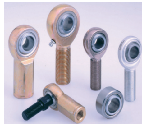
Le teste a snodo e gli snodi sferici AURORA sono utilizzati per gli impieghi più gravosi, in quanto particolarmente resistenti all'usura.