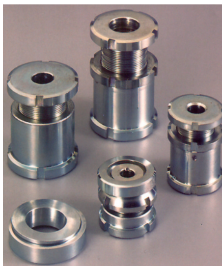
La gamma di distanziali regolabili RODOSET presenta caratteristiche tecniche uniche.

L'azienda genovese è presente nei seguenti principali settori di mercato: costruzione di macchine utensili, macchine industriali automatiche per lavorazioni, trattamenti, confe-