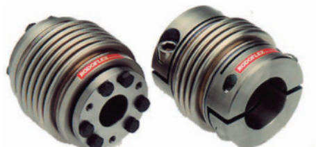
Tutti i giunti a soffiutto metallico RODOFLEX sono forniti pronti al montaggio con foratura dei mozzi già nel diametro definitivo.