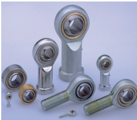
Un insieme rappresentativo della gamma di teste a snodo e snodi sferici RODOBAL, distribuiti da Getecno srl.